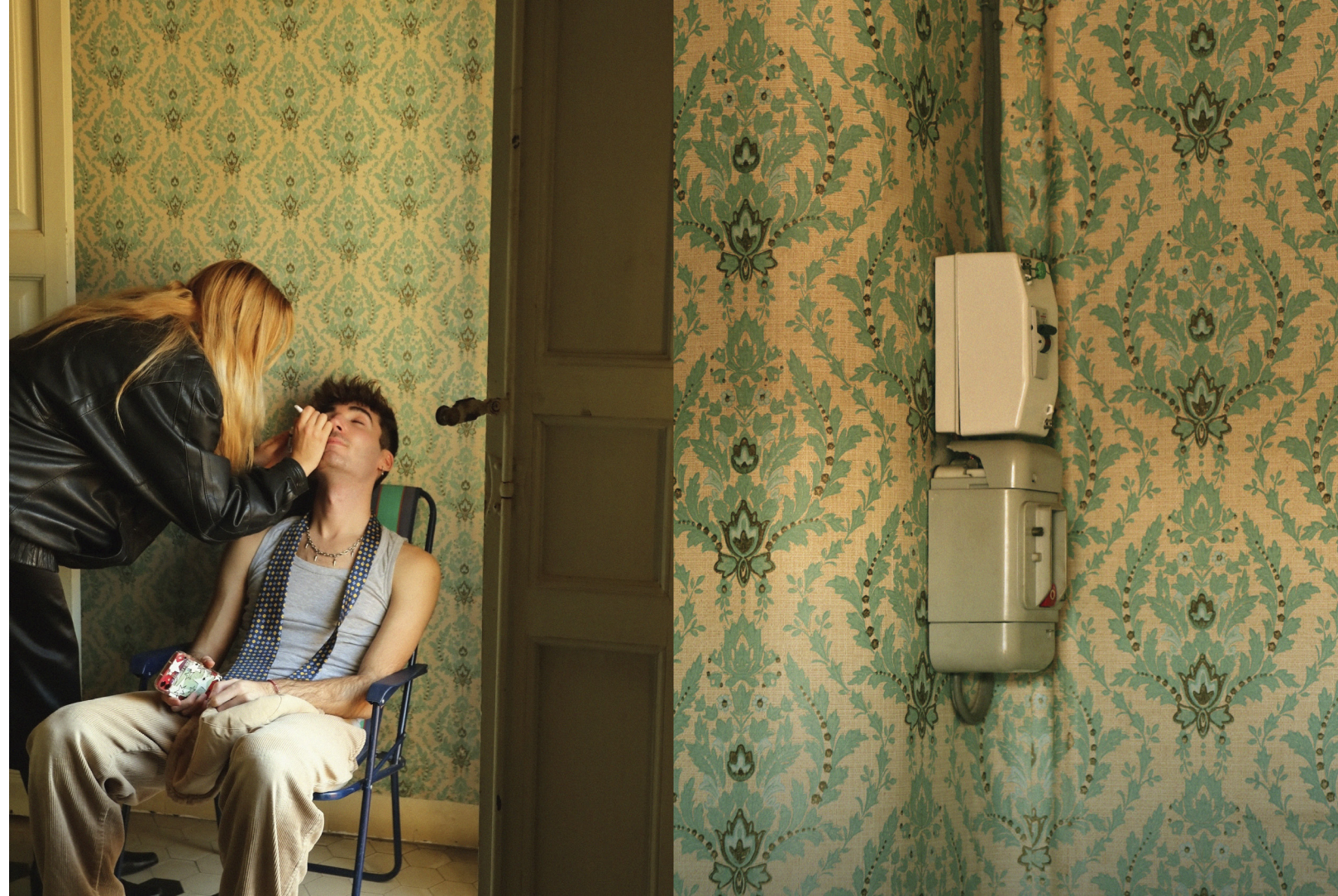
Detalle Menor IV (2024)