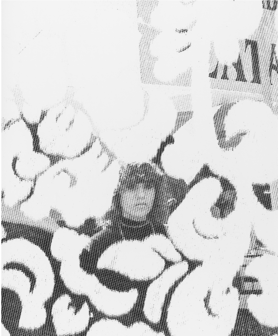
Encajes I (2024)