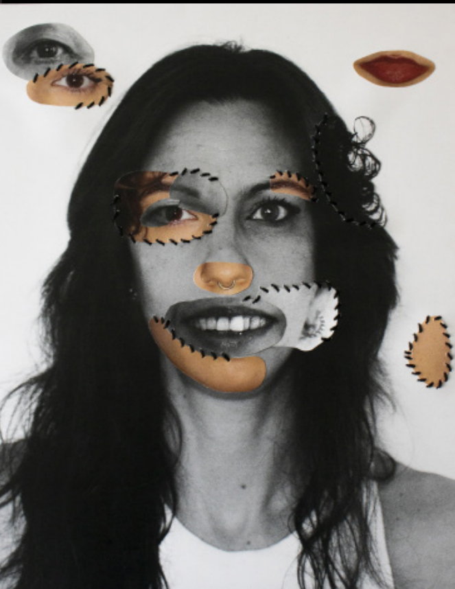
AbuelaMadreHija (2024), collage y bordado fotográfico