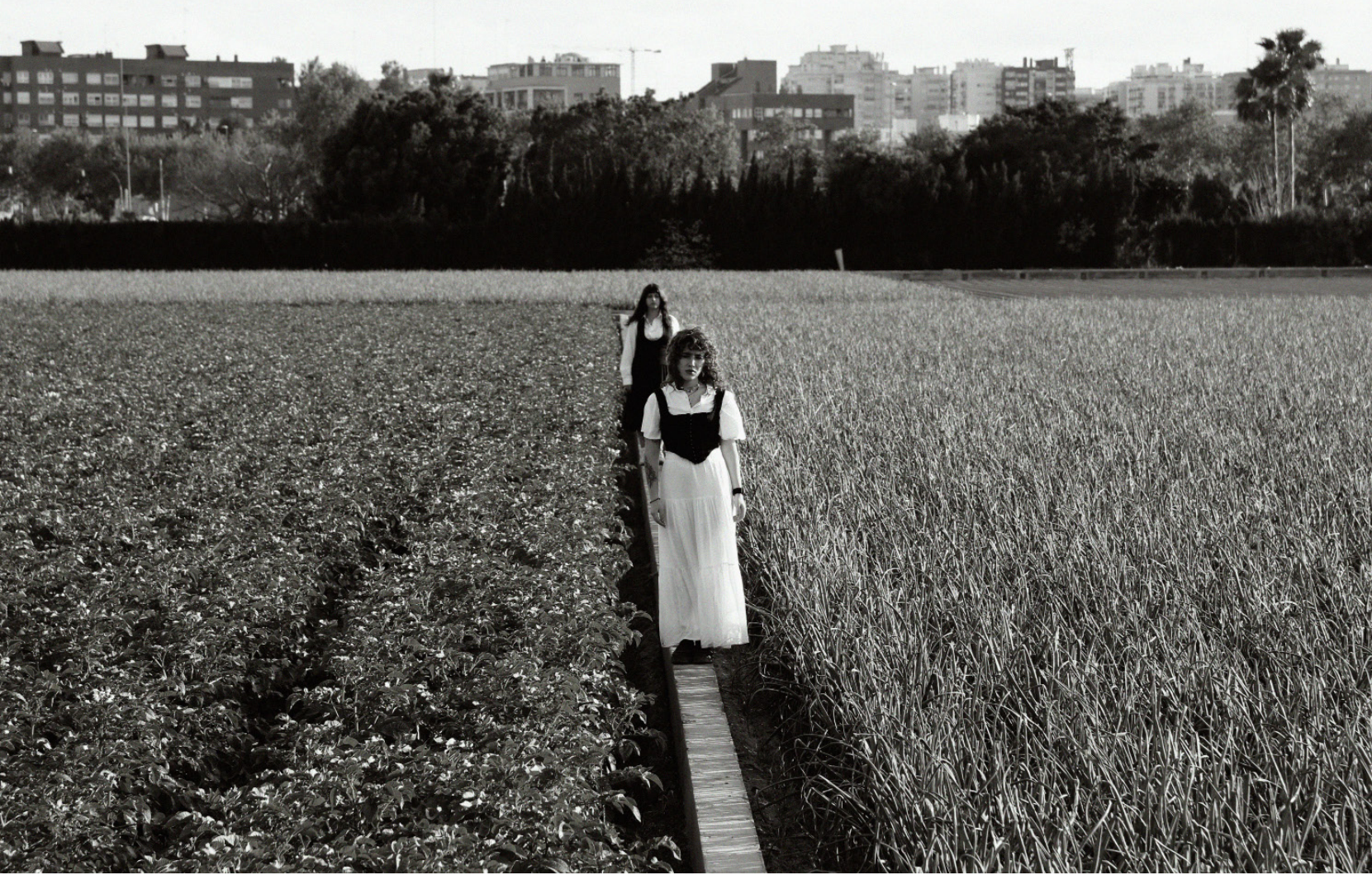
La escenografía del juego (2024)