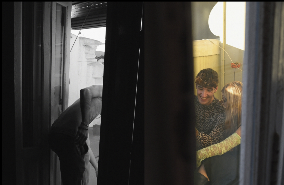
Detalle Menor I (2024), digital, 23x34 cm

La propuesta Detalle Menor recoge una investigación sobre la importancia de lo habitual, de todo aquello que no observamos detenidamente. El ojo está habituado a mirar generando una imagen práctica y general de lo que nos rodea. Sin embargo, esta serie de fotografías invitan al ejercicio contrario. Se trata de practicar el mirar y observar descubriendo nuevos mundos que no somos capaces de asimilar en la rapidez del día a día.