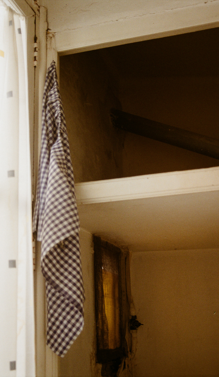
Detalle díptico (2024) Película 35mm