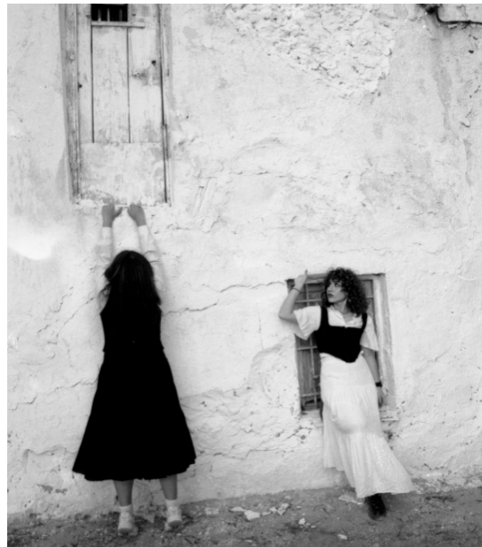
La escenografía del juego (2024)